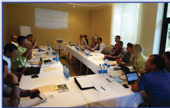
Спеціалізований тренінг «Захист наркозалежних осіб та секс-працівників механізмами громадського моніторингу та експертизи», м. Алушка, 5 вересня 2012 року

Чимала увага зверталась на стратегічні справи, можливість впливу через стратегічні справи на національну практику та законодавство, практику Європейського Суду в питаннях, які стосуються наркозалежних та ВІЛ-інфікованих, механізм моніторингу порушень правоохоронними органами прав наркозалежних та ВІЛ-інфікованих.