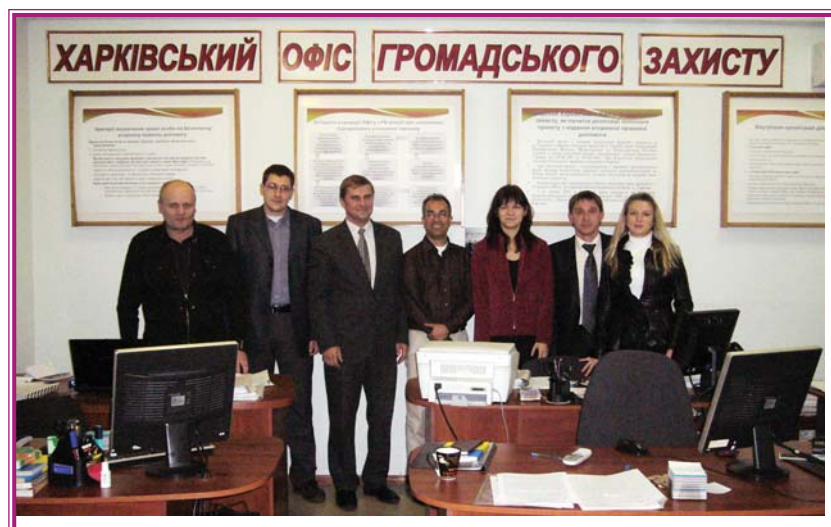
Співробітники Офісу громадського захисту в м. Харкові

В результаті реалізації проекту з підтримки Офісів громадського захисту було розпочато та продовжено апробацію роботи ОГЗ як моделі надання вторинної безоплатної правової допомоги у кримінальних справах, яка б забезпечила своєчасний, ефективний та якісний захист прав і законних інтересів осіб в містах, де працюють ці офіси, забезпечувався доступ адвоката з моменту фактичного затримання особи, що б сприяло забезпеченню конституційних гарантій своєчасного, ефективного та якісного захисту прав і законних інтересів осіб при кримінальному переслідуванні.